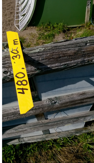
Virallisesti mitatut matkat 280 m, 350 m ja 480 m.