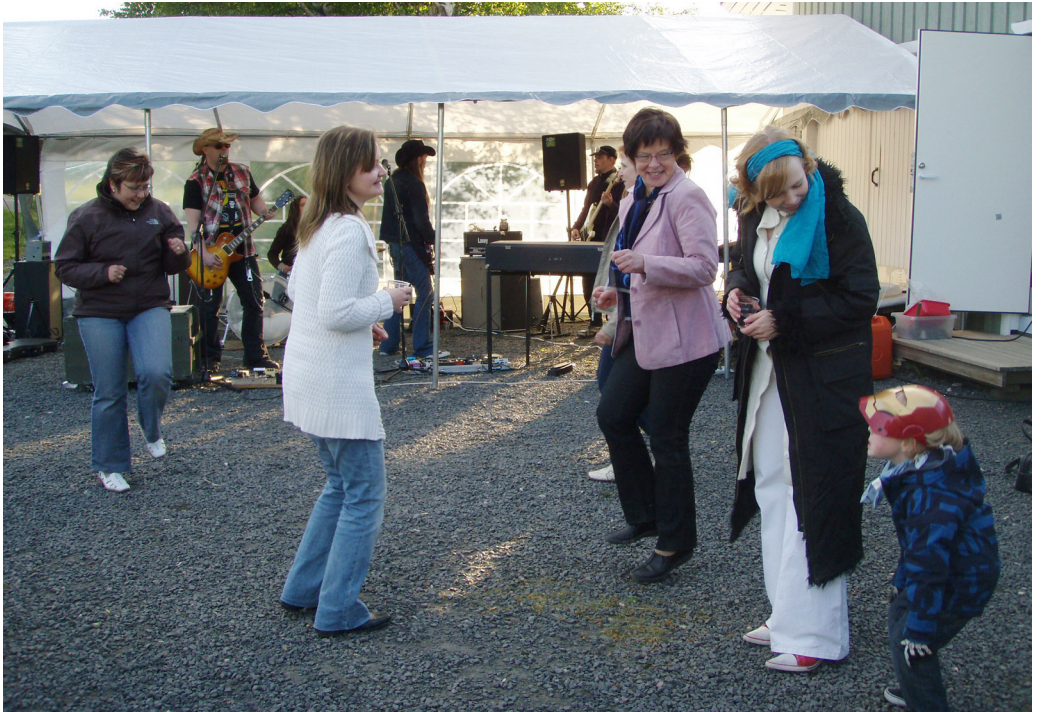
Pysyi lämpimänä, kun tanssi välillä. Pikkumies osallistui innokkaasti.