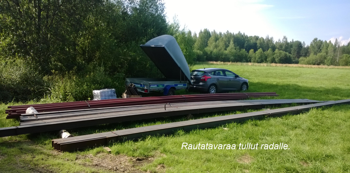
Rautatavaraa tullut radalle.

Kauden aikana LL piti torstaisin useita pentuharjoitusiltoja. Koirat juoksivat sekä maastossa että radalla.