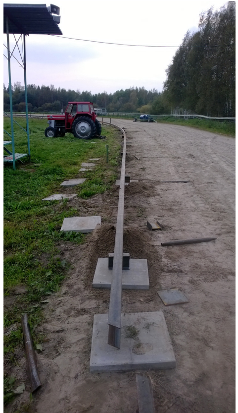
Uusi kisko hahmottuu.