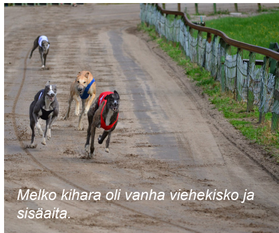
Melko kihara oli vanha viehekisko ja sisäaita.

alulla ja päättyivät elokuun lopussa. Rataharjoituksia pidettiin vuoroviikoin EGU:n kanssa, maastoharjoituksia LL veti joka tiistai.