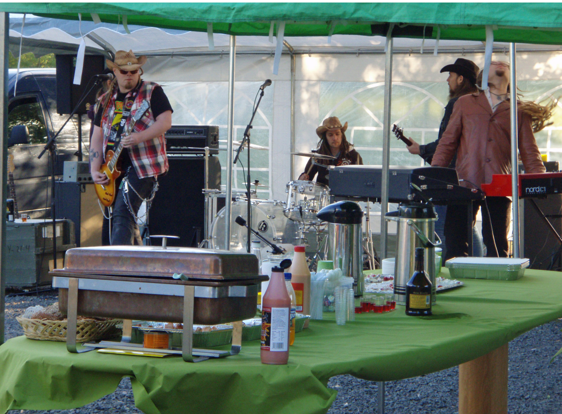
Livebändi piti 40-vuotisbileissä tunnelmasta huolen.

Toukokuussa juostiin maastokisat, osana myös SGY:n greyhoundien maastomestaruus.