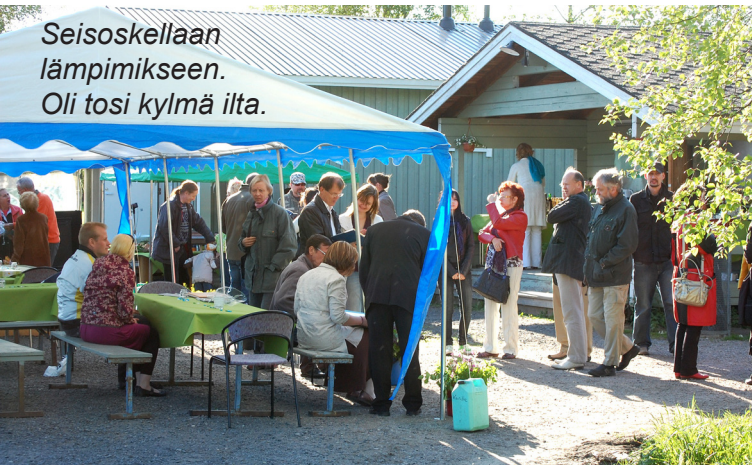
Seisokellaan lämpimikseen. Oli tosi kylmä ilta.