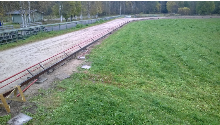
Etusuora uuden kiskon kanssa.

Yhteistyö EGU:n kanssa jatkui. Yhteistyö alkoi Dog Forge One ry:n kanssa. Yhdistys järjesti torstaisin maastoharjoitukset muille kuin vinttikoirille.